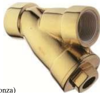
Fig12, 3/8" do 2 1/2"